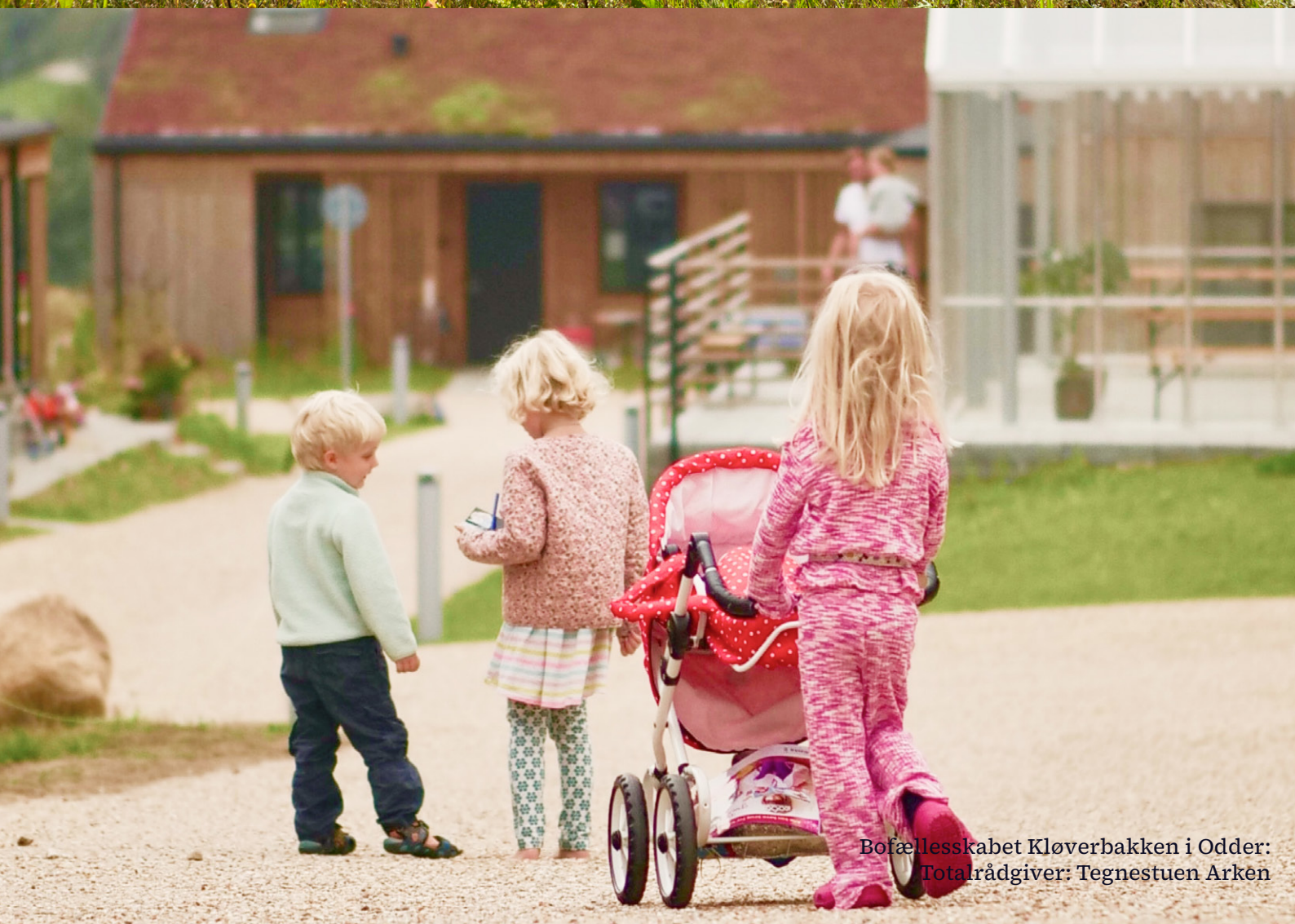
Bofællesskabet Kløverbakken i Odder: Totalrådgiver: Tegnestuen Arken